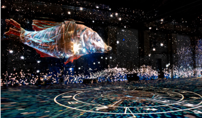
Franz Fischaller: THE GREAT CIRCLE , 2022 Immersive Multimedia-Installation, Installationsansicht KUNSTKRAFTWERK Leipzig

Die immersive Multimedia-Installation THE GREAT CIRCLE (2022) ist eine von New Media Künstler Franz Fischaller gestaltete digitale Komposition und eine Hommage an Tübkes Monumentalbild. Über die Wände der Maschinenhalle des KUNSTKRAFTWERK in Leipzig gleiten ausgewählte Szenen aus Tübkes Bauernkriegspanorama. Untermalt von Soundeffekten von Steve Bryson werden die Figuren lebendig und die Besucher*innen selbst Teil der 360° Inszenierung.